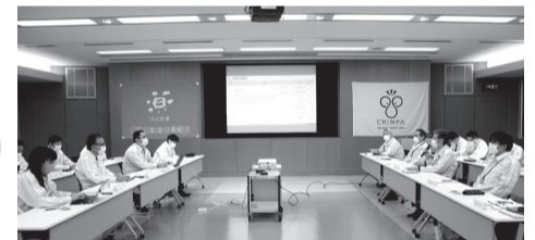
労使特別委員会全体写真