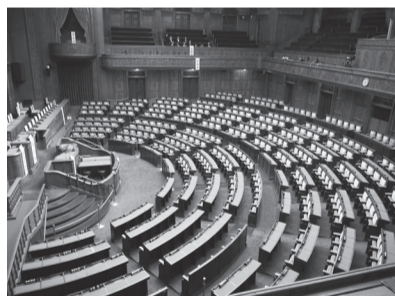
実際に見る議場は テレビで見るより圧巻でした!