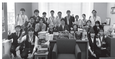
将来この議員事務所で働く ネクストリーダーがいるかも?