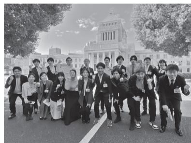
国会の前で集合写真