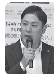
中島よしき 様 日野市議会議員