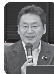
いそぎ哲史 様 参議院議員