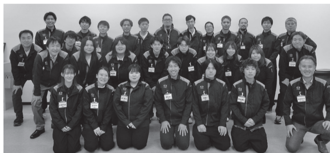
第64期前半期 ネクストリーダーの皆さん