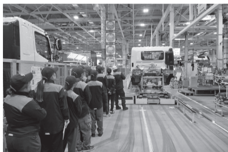
古河工場見学の様子②