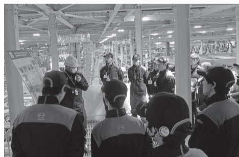
古河工場見学の様子①