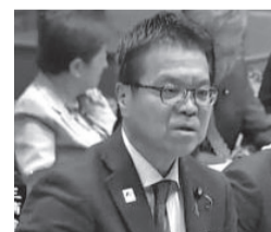
はまぐち 誠 参議院議員