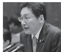
いそざき 哲史 参議院議員